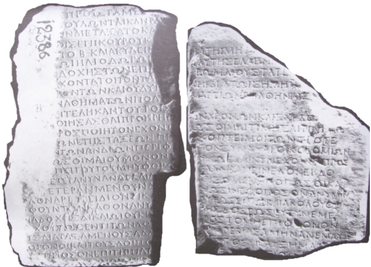
Η ΕΠΙΓΡΑΦΗ του 125μ.χ.χ.